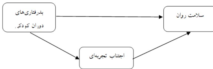
Figure 1. Proposed model

مباحث مطرح شده، پژوهش حاضر بر آن است که روابط ساختاری بدرفتاری‌های دوران کودکی، اجتناب تجربه‌ای و سلامت روانی را بررسی نماید. شکل ۱ مدل مفهومی پژوهش را نشان می‌دهد.